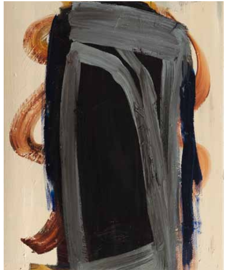
Schwarzer Häuptling 2012 Öl auf Leinwand 120 x 100 cm