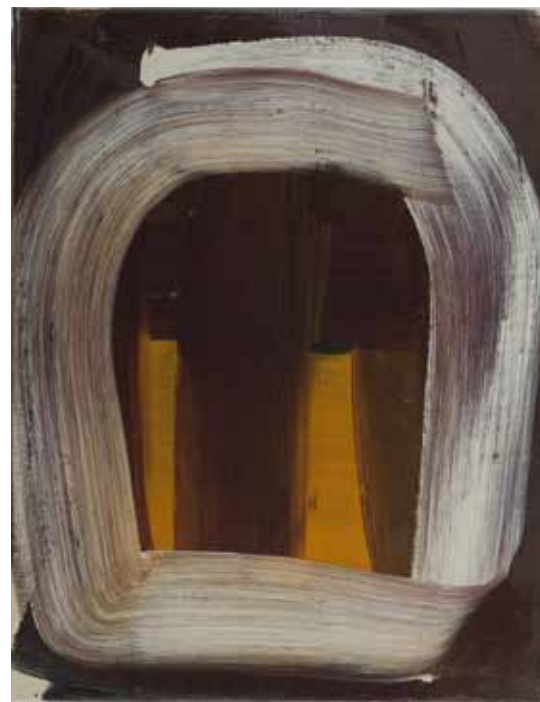
Kopf 2005 Öl auf Leinwand 62 x 48 cm