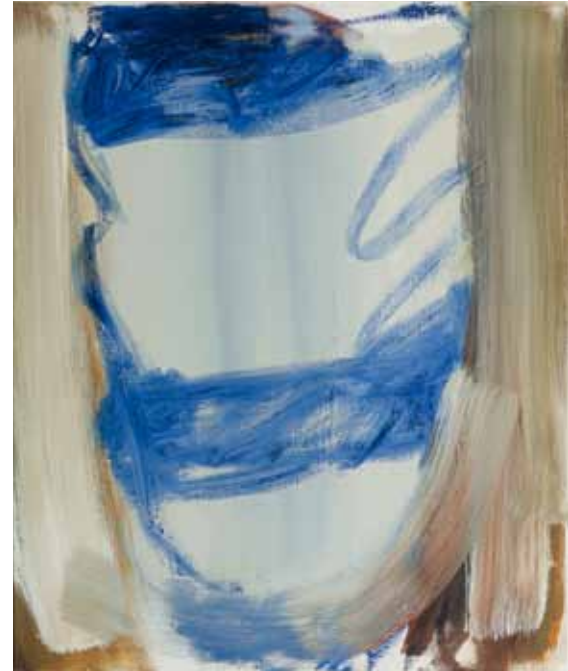
Hauptling 2 2012 Öl auf Leinwand 60 x 50 cm