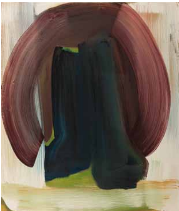
Ohne Titel 2005 Öl auf Leinwand 70 x 60 cm