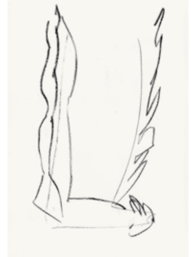
Häuptlinge – männlich 3-teilig 2012 Kohle auf Papier je 42 x 29,7 cm