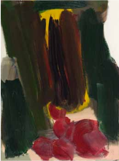
Häuptling (Grün) 2013 Öl auf Leinwand 80 x 60cm