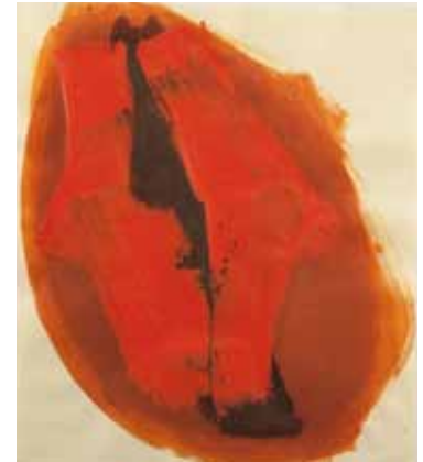
Inkarnation 3-teilig 2007 Öl und Tusche auf Büttenpapier je 55 x 48 cm