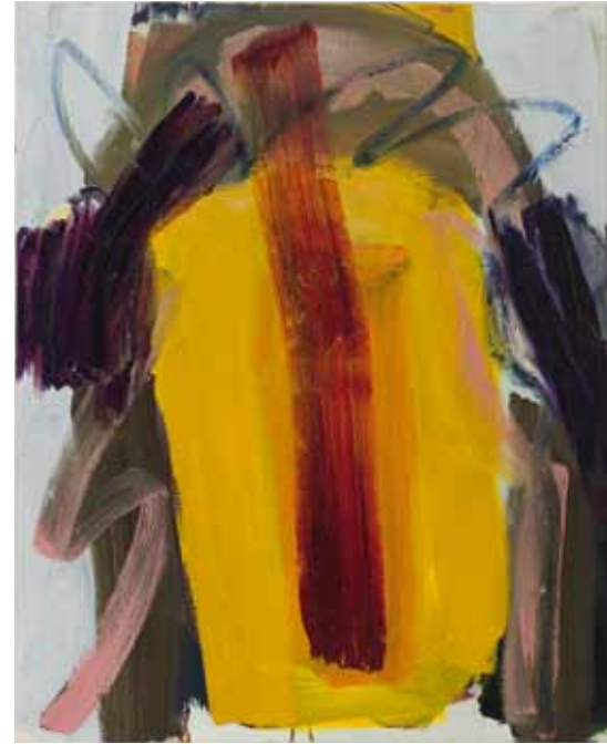
Sonnenhäuptling 2013 Öl auf Leinwand 100 x 80 cm