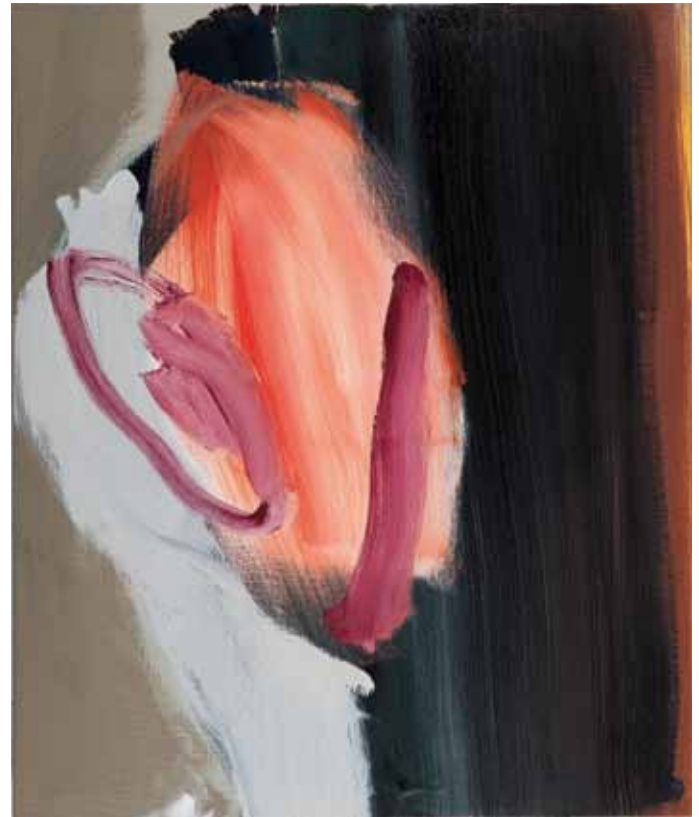
Hohe Frucht 2011 Öl auf Leinwand 60 x 50 cm