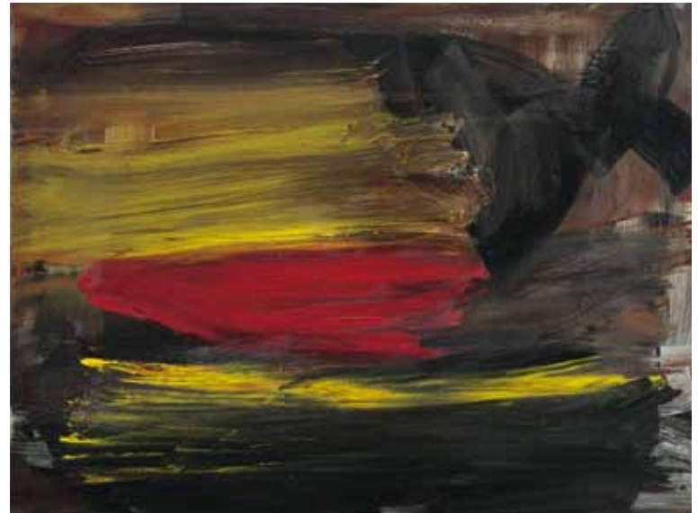
Ohne Titel 2005 Öl auf Leinwand 60 x 80 cm