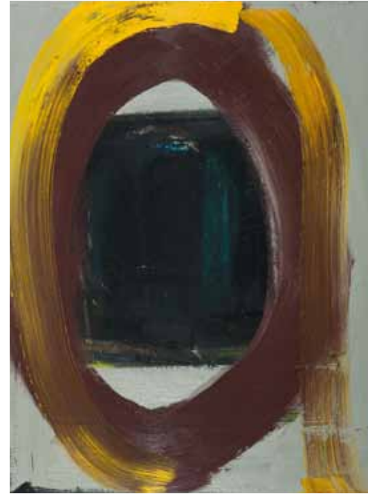
| FREUDE IN DER BEGEGNUNG