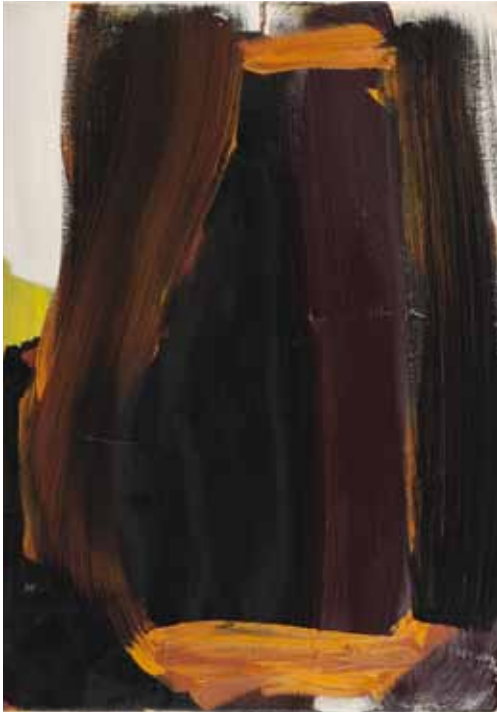
Ohne Titel 2012 Öl auf Leinwand 70 x 50 cm