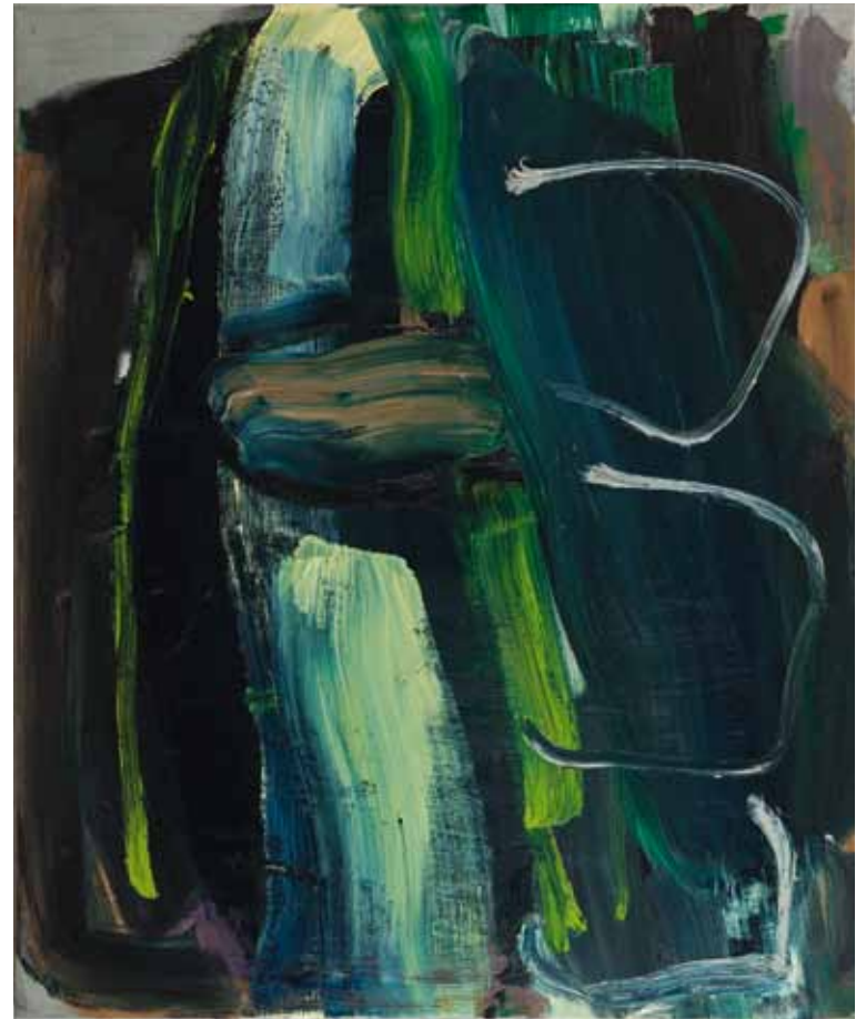
Wasserfall 2010 Öl auf Leinwand 120 x 100 cm