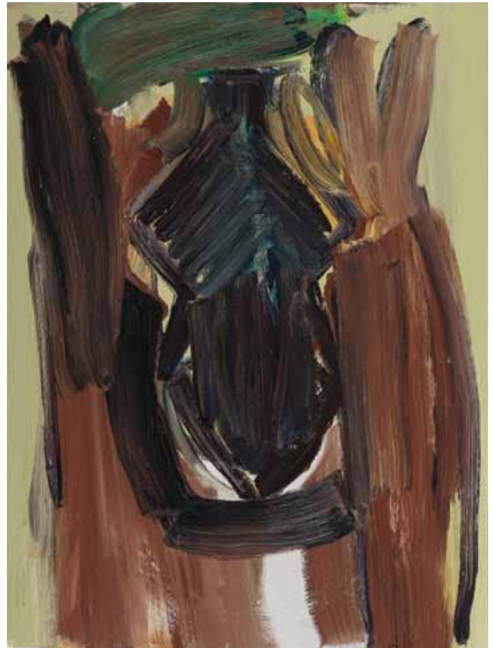
Häuptling (Ältester) 2012 Öl auf Leinwand 80 x 60cm