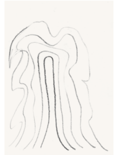
Häuptlinge – weiblich 3-teilig 2012 Kohle auf Papier je 42 x 29,7 cm