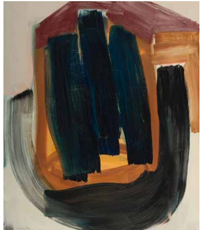
Gedankenhaus 2007 Öl auf Leinwand 70 x 60 cm