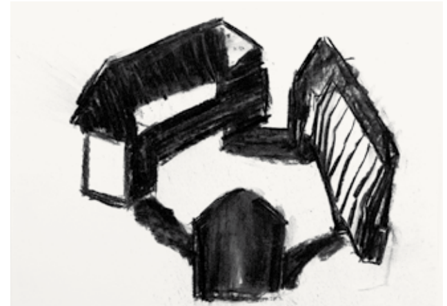
Das Gut 2008 Kohle auf Papier 29,7 x 42 cm