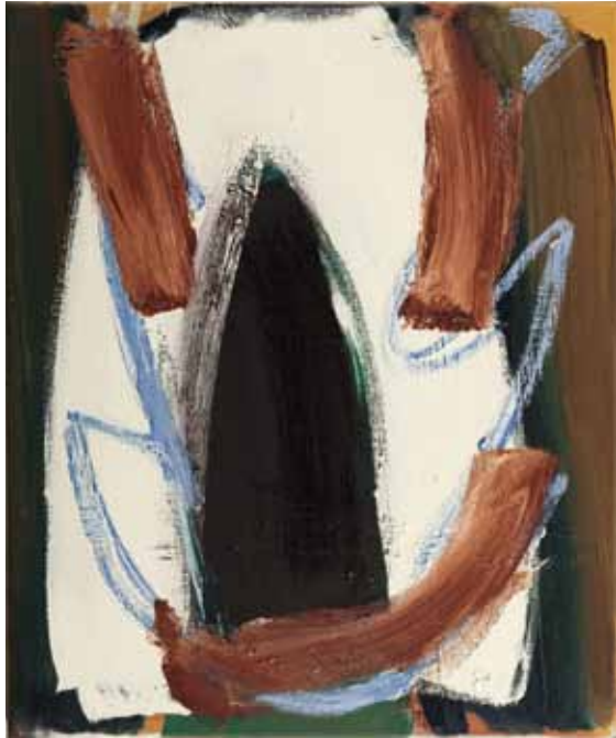
Hauptling 1 2012 Öl auf Leinwand 60 x 50 cm