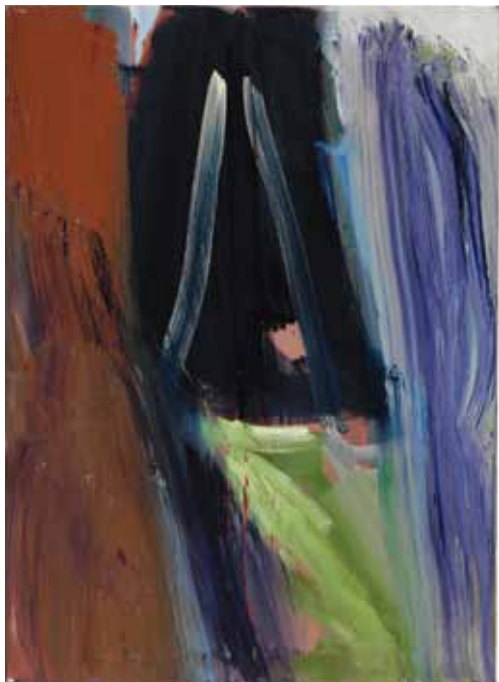
Ohne Titel 2009 Öl auf Leinwand 87 x 63 cm