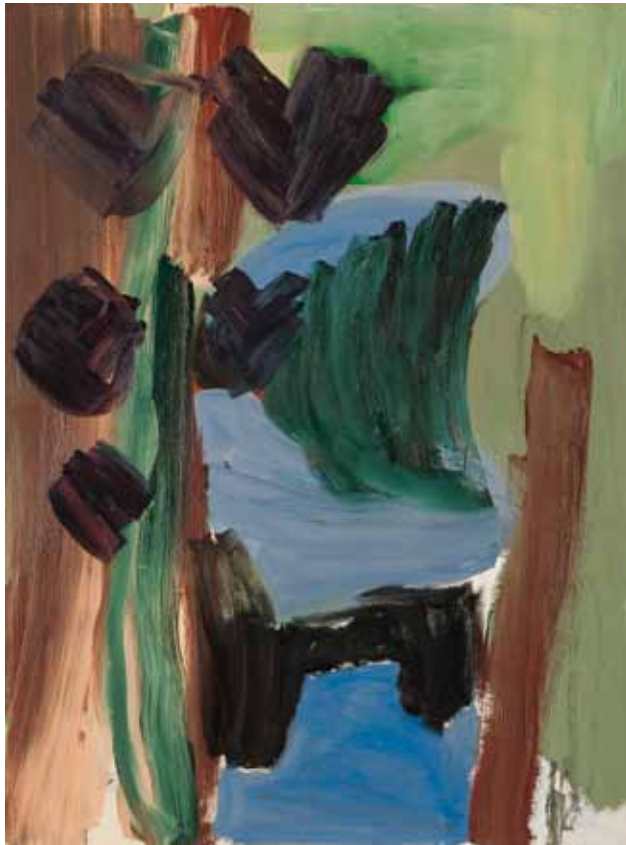
Fluss 2011 Öl auf Leinwand 160 x 120 cm