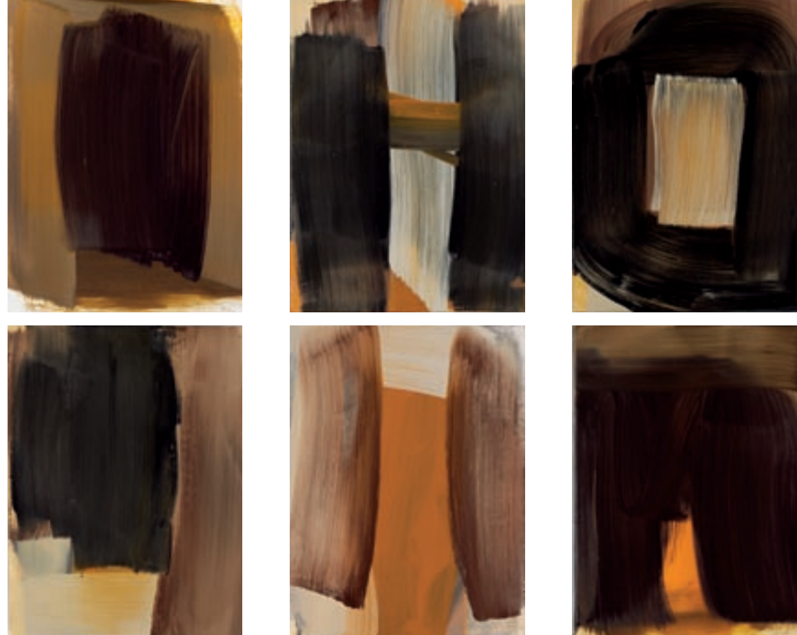
Ohne Titel, 12-teilig, 2004, Öl auf Leinwand, je 40x30 cm (Ausschnitt), Privatsammlung Stuttgart