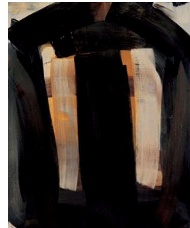
Ohne Titel, 2004, Öl auf Leinwand, 120x100 cm