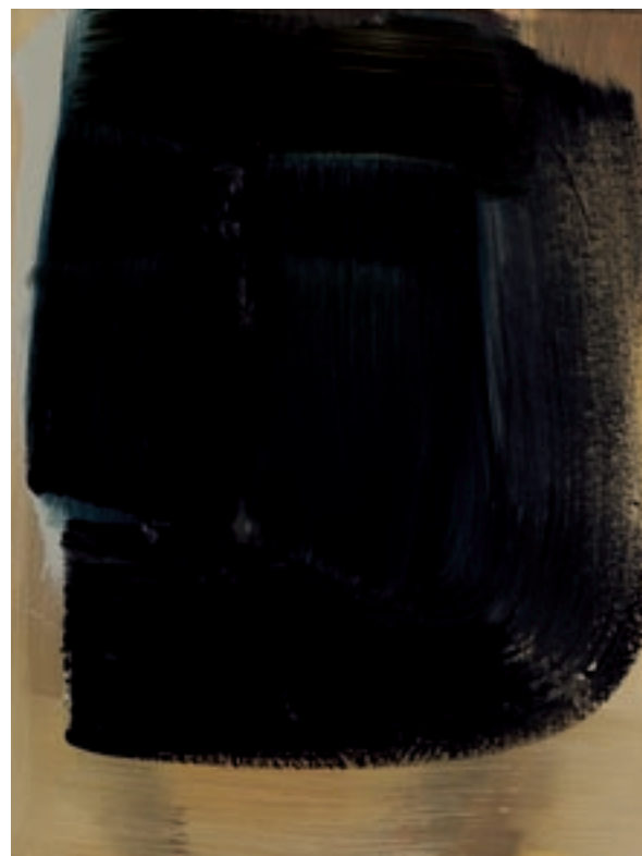
Ohne Titel, 2004, Öl auf Leinwand, 40x30 cm